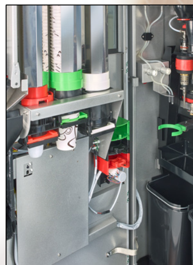
Coffee to go inside